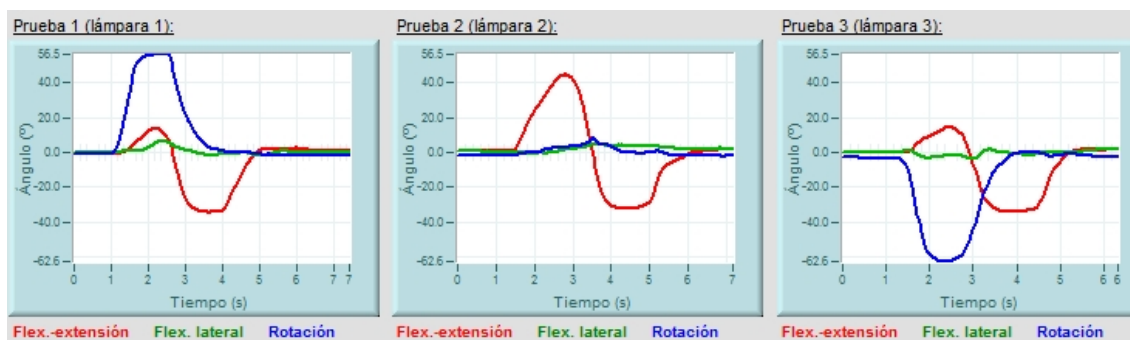
Figura 3 : Gráfico de la movilidad del raquis cervical al dirigir el paciente su mirada a una lámpara situada a su izquierda (lámpara 1), encima de él (lámpara 2) y a su derecha (lámpara 3).