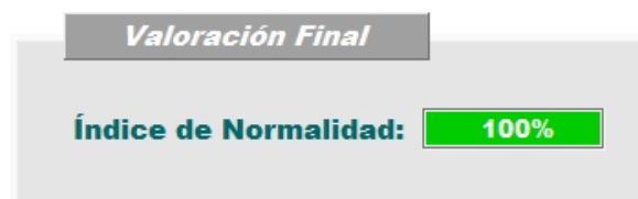
Tabla 3: Resultado final global de la funcionalidad del raquis cervical. Valores inferiores al 90% en el índice de normalidad se consideran no normales o alterados funcionalmente

El apoyo de la Comisión Europea para la producción de esta publicación no constituye una aprobación del contenido, el cual refleja únicamente las opiniones de los autores, y la Comisión no se hace responsable del uso que pueda hacerse de la información contenida en la misma.